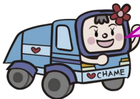
ごみ収集車キャラクター チャメ子

札幌市に「廃棄物減量計画書」を提出する目的であれば申込みできます。お申込み方法は、次のページをご覧ください。