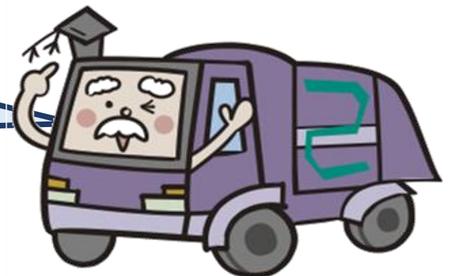
ごみ収集車キャラクター パッカー博士