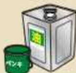
廃油・塗料の 入ったままの容器