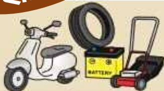
オートバイ・自動車・タイヤ・ バッテリー・エンジン付きのもの