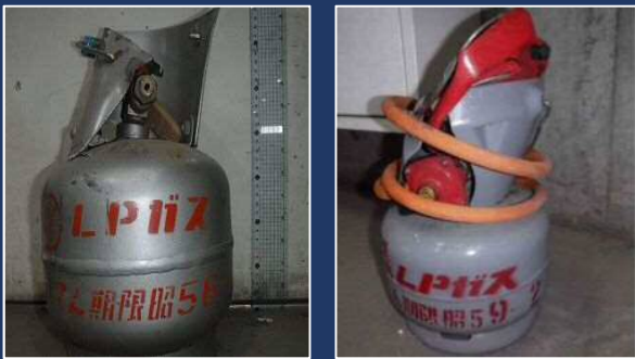
混入されていたプロパンガスボンベ